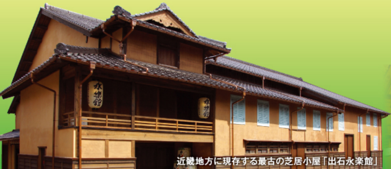
近畿地方に現存する最古の芝居小屋「出石永楽館」